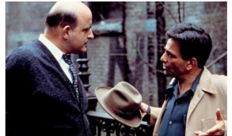
1978 TÊTES VIDES CHERCHENT COFFRES PLEINS (The Brink's Job) de W. Friedkin avec Peter Falk