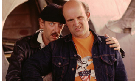
1973 LE MONDE À L'ENVERS (Steelyard Blues) d'Alan Myerson avec Donald Sutherland