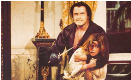
1976 LE PIRATE DES CARAÏBES (Swashbuckler) de James Goldstone avec Geneviève Bujold