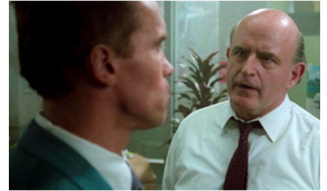
1988 DOUBLE DÉTENTE (Red Heat) de Walter Hill avec Arnold Schwarzenegger