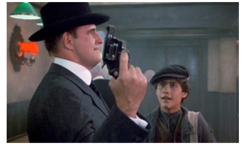
1984 JOHNNY LE DANGEREUX (Johnny dangerously) d'Amy Heckerling avec Byron Thames