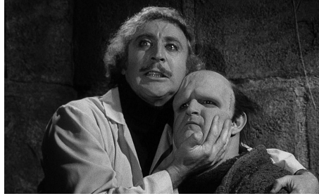
1974 FRANKENSTEIN JUNIOR (Young Frankenstein) de Mel Brooks avec Gene Wilder