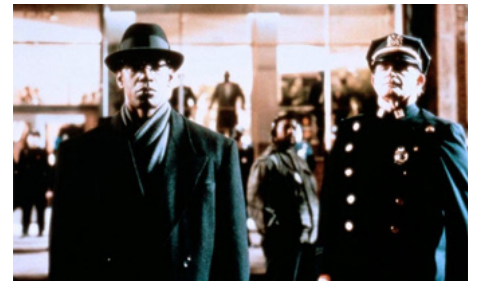
1992 MALCOLM X (Malcolm X) de Spike Lee avec Denzel Washington