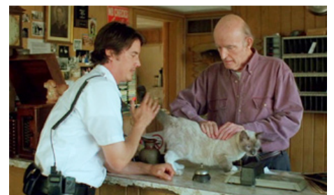
2008 AU CŒUR DU HARAS (All Roads Lead Home) de Dennis Fallon de Jason London