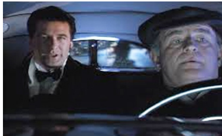
1994 THE SHADOW (The Shadow) de Russell Mulcahy avec Alec Baldwin