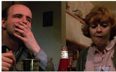
1970 JOE, C'EST AUSSI L'AMÉRIQUE (Joe) de John G. Avildsen avec K. Callan