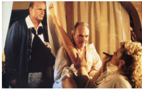
1983 BARBE-D'OR ET LES PIRATES (Yellowbeard) de Mel Damsky avec James Mason, Greta Blackburn