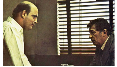
1973 LES COPAINS D'EDDIE COYLE (The Friends of Eddie Coyle) de Peter Yates avec Robert Mitchum