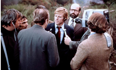
1972 VOTEZ MCKAY (The Candidate) de Michael Ritchie avec Robert Redford