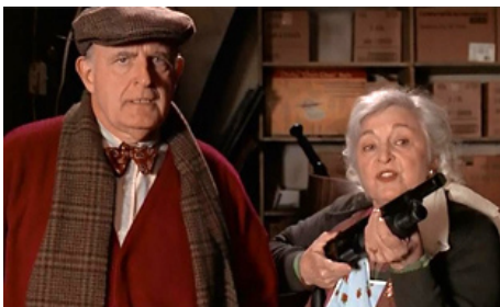
1997 LE NOUVEL ESPION AUX PATTES DE VELOURS (That darn Cat) de Bob Spiers avec Rebecca Scholl