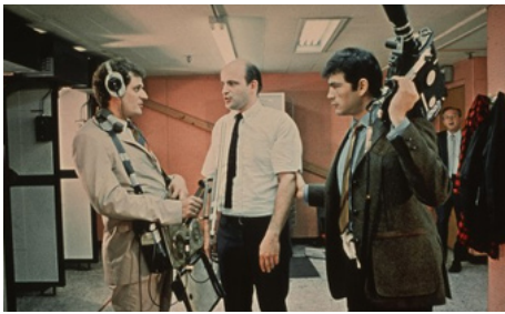
1969 OBJECTIF VÉRITÉ (Medium Cool) d'Haskell Wexler avec Robert Forster