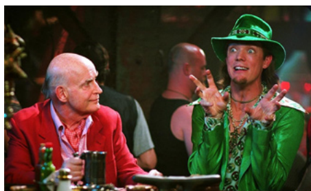
2004 SCOOPY-DOO 2, Les Monstres se déchainent (Scooby-Doo 2) de Raj Gosnell avec Matthew Lillard