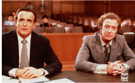
1987 CORDES ET DISCORDS (Surrender) de Jerry Belson avec Michael Caine