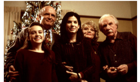
1995 L'AMOUR À TOUT PRIX (While you were sleeping) de Jon Turteltaub avec M. Keena, S. Bullock, J. Warden