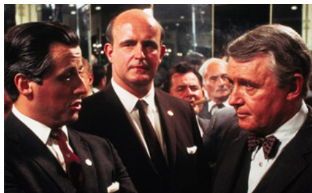
1979 F.I.S.T. (F.I.S.T.) de Norman Jewison avec Sylvester Stallone, Rod Steiger