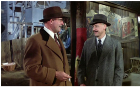
1982 HAMMETT (Hammett) de Wim Wenders avec Frederick Forrest