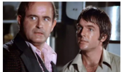
1979 LE DERNIER SECRET DU POSÉIDON (Beyond the Poseidon Adventure) d'I. Allen avec Mark Harmon