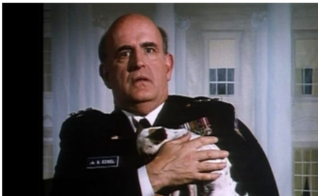
1989 CANNONBALL 3 (Speed Zone) de Jim Drake