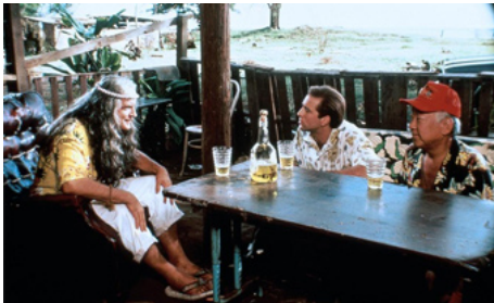
1992 LUNE DE MIEL À LAS VEGAS (Honeymoon in Vegas) d'Andrew Bergman avec N. Cage, P. Morita