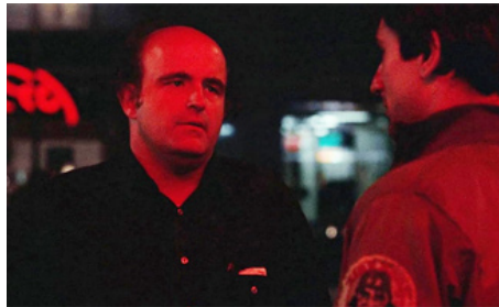
1976 TAXI DRIVER (Taxi Driver) de Martin Scorsese avec Robert De Niro