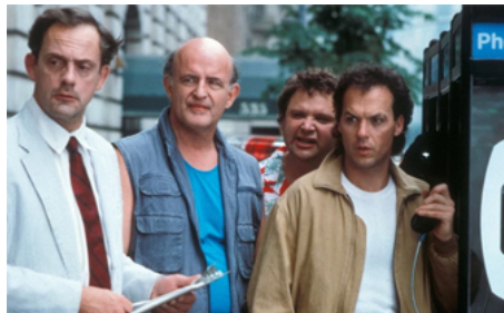
1989 UNE JOURNÉE DE FOUS (The Dream Team) d'Howard Zieff avec Christopher Lloyd, M. Keaton