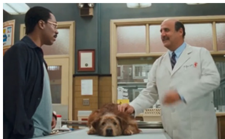
1997 DOCTEUR DOLITTLE (Dr Dolittle) de Betty Thomas avec Eddie Murphy