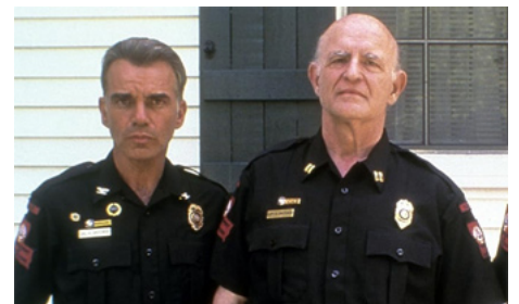
2001 À L'OMBRE DE LA HAINE (Monster's Ball) de Marc Forster avec Billy Bob Thornton