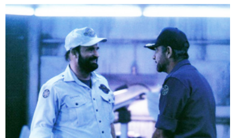
1981 OUTLAND, LOIN DE LA TERRE (Outland) de Peter Hyams avec Sean Connery