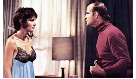
1974 JOE LE FOU (Crazy Joe) de Carlo Lizzani avec Paula Prentiss