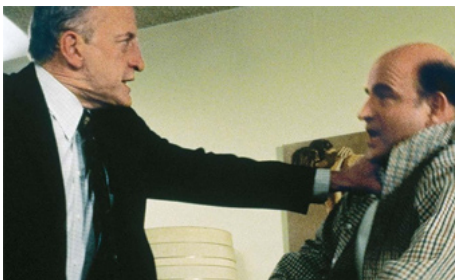
1979 HARDCORE (The Hardcore Life) de Paul Schrader avec George C. Scott