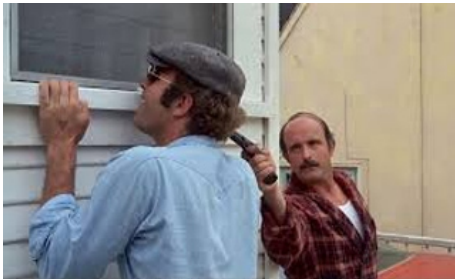
1973 LA CHASSE AUX DOLLARS (Slither) d'Howard Zieff avec James Caan