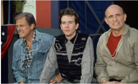
1985 TURK 182 (Turk 182) de Bob Clark avec Robert Culp, Timothy Hutton